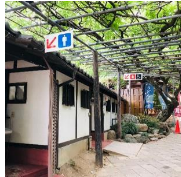
トイレは移設中央に一か所。 多目的トイレもあります。

少し遠いですが、しばし都会から離れて自然を満喫しませんか(^ ^ ) 皆様のご参加をお待ちしております。