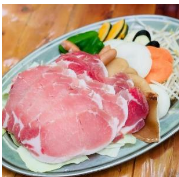
豚肉・もやし・しいたけ・ピーマン ウインナー・かぼちゃ・人参・なす