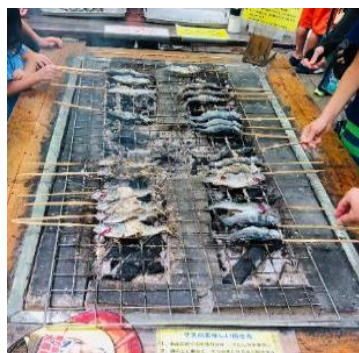
焼きたてをどうぞ(^^)

この日はシーズンオフで釣り場の様子は写真に撮ることができませんでしたが釣ったマスはワタ処理を済ませ焼き場で焼いて昼食と一緒に食べることができます。(持ち帰ることはできません)