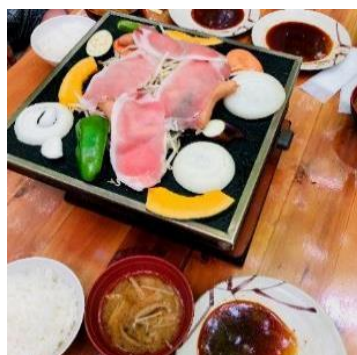
ご飯・きのこ汁はおかわり自由 たくさん食べられますねー！