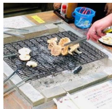
収穫したしいたけは焼いて食べることも持ち帰ることもできます。