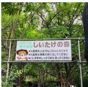
森林の中を進んでいきます。