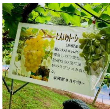
美味しいぶどうの見分け方を レクチャーしてくれます。

ぶどうは30分食べ放題です。 あれが美味しそうだね！なんて 話しながら自分で収穫した ぶどうの味は格別ですよ(^^) この日の品種はヒムロツ。 10月末はきっと巨峰かな？と 施設の方が教えてくれました。