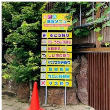
入り口には体験メニューが