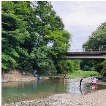
お天気によっては川遊びも。