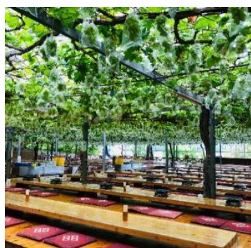
お食事処はゆったりとしたお座敷です。