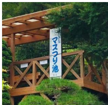
山の中腹に池があります。