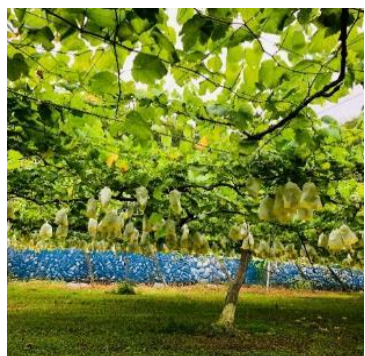
ぶどうのカーテン！