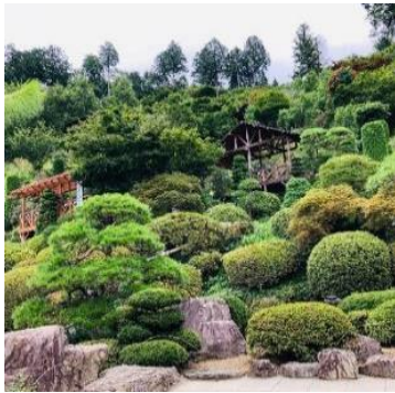
15分ほどの散策コース。 ハンモックもあります。ゆらゆら。